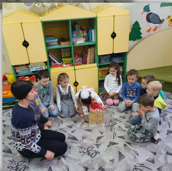
«Угадай что это?»