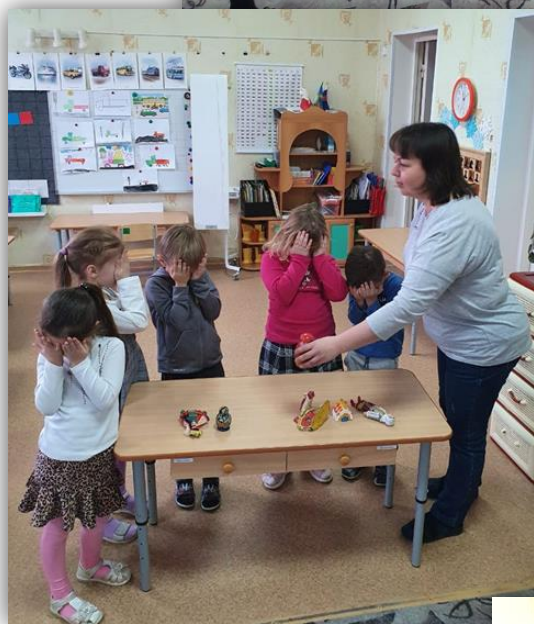
«Чего не стало?»